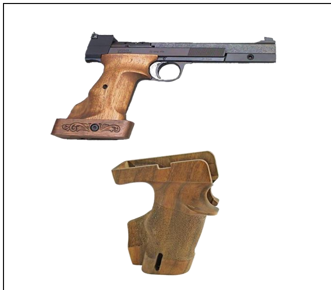
Talas Anatômicas Vedadas